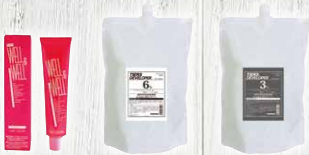
WELL&WELL ヘアカラー 1剤 120g 医薬部外品