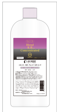
400ml (システイン入“ケラチン乳液”)

システインを高濃度に含有した“予防美容”の濃密ケラチン乳液 (濃縮インナーサプリ)