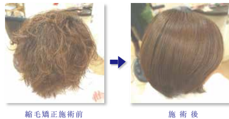
縮毛矯正施術前 施術後

ダメージの修復&予防 システイン酸の生成を抑制 ウェーブ効率UP ハリ・コシ弾力UP マトリックスを補修 保湿&エモリエント効果 保護皮膜の形成