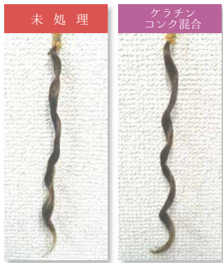
※ハイダメージ毛にパーマ(ロッド=14mm)